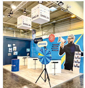
Abb. 1: Messestand DMRZ.de Taximesse Essen 2022